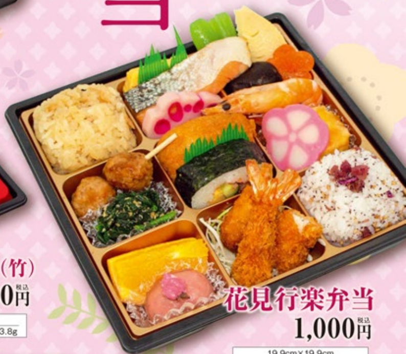
花見行楽弁当 1,000円 税込