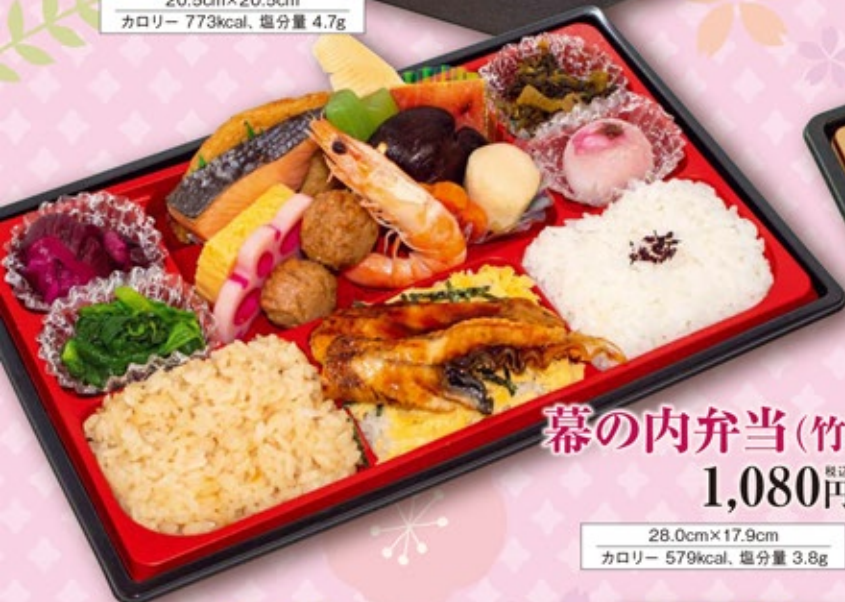
幕の内弁当(竹) 1,080円 税込