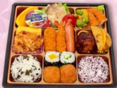
こども行楽弁当 720円 税込