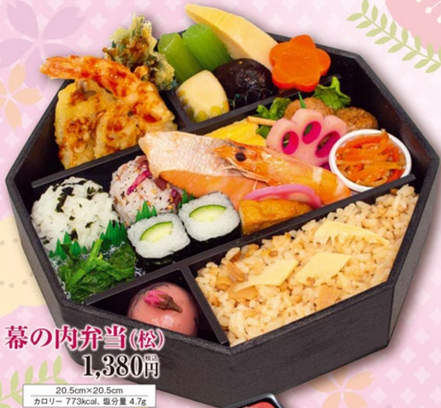
幕の内弁当(松) 1,380円 税込