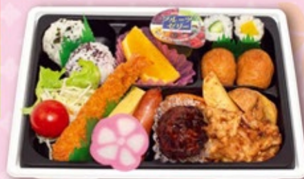
コロコロ弁当 540円 税込