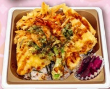
春野菜天丼 630円 税込